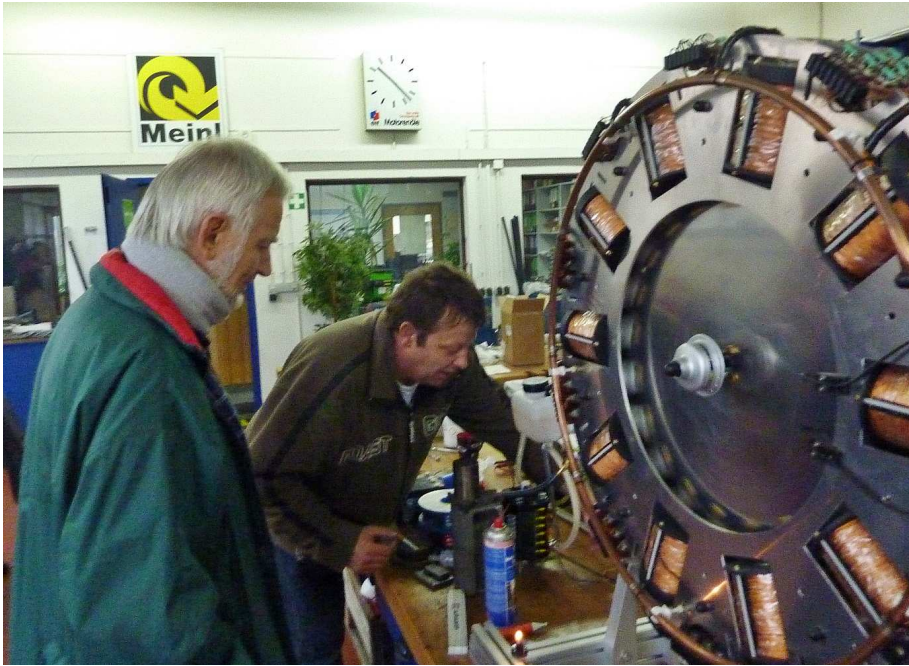
Zu Besuch bei der Baumaschinen-Firma Meinl bei der Besichtigung eines Bedini-Charger-Prototyps zur Batterie-Rückladung.

doch wegen zu kleiner Dimensionierung nicht funktionierte, d. Red.)